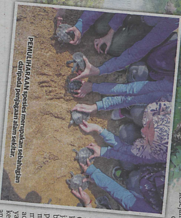
PEMULIHARAAN spesies merupakan sebahagian daripada penjagaan alam sekitar.

ORANG ramai berpeluang memikmati keindahan alam sekitar program pemuliharaannya sentiasa dilaksanakan.