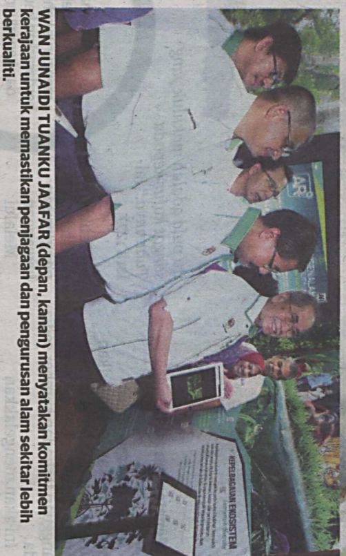
WAN JUNAIDI TUANKU JAAFAR (dapan, kanan) menyatakan komitmen kerajaan untuk memastikan penjagaan dan pengurusan alam sekitar lebih berkualiti.

Maklumat tentang undang-undang ini mestilah diterjemahkan dengan cara terbaik untuk semua masyarakat supaya faham, mempunyai kesedaran dan menjadi agen kerajaan dalam memastikan undang-undang berjalan selari dengan dasar kerajaan tentang alam sekitar dan kepelbagaian biologi untuk kepentingan masyarakat dan negara. Perkara kedua penting ialah pengetahuan yang lengkap