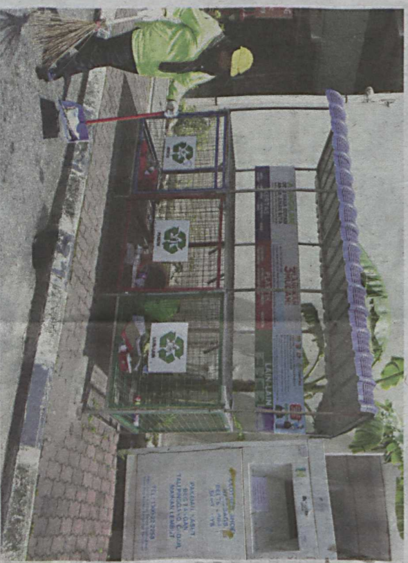
PROGRAM kitar semula antara kaedah pemuliharaan yang terbaik.

Kalau sungai tercemar di hulu maka kesannya juga dapat dilihat di hilir dan muara sungai.