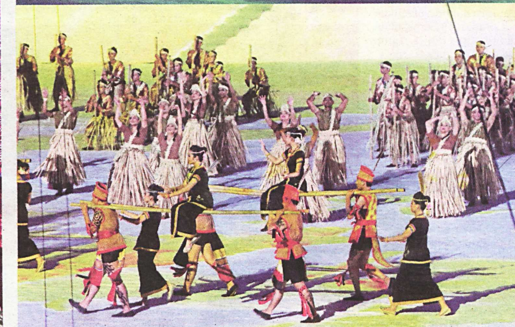
ANTARA persembahan kebudayaan yang dipertunjukkan malam tadi.