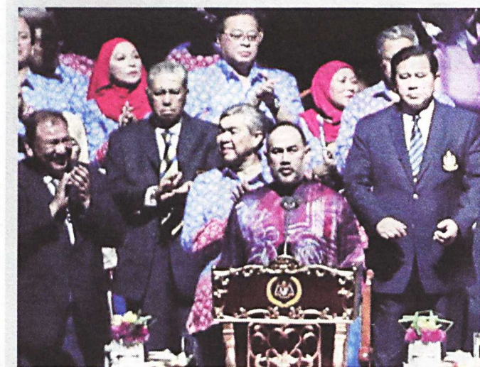
YANG di-Pertuan Agong Sultan Muhammad V menyampaikan titah ucapan perasmian.