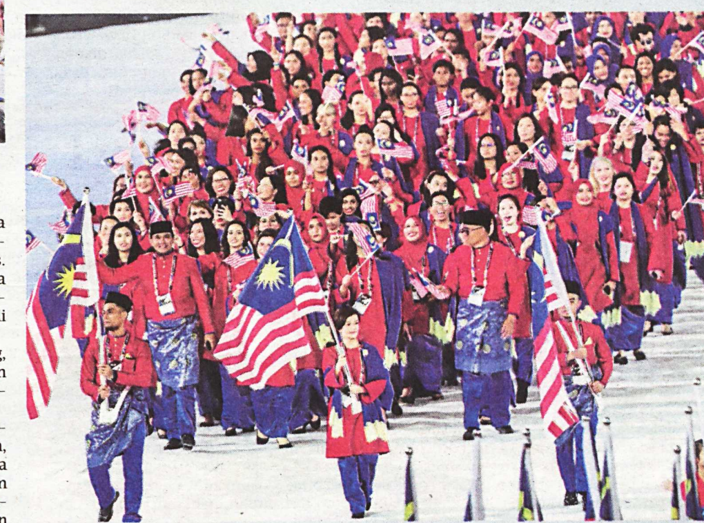
KONTINJEN negara memasuki stadium.