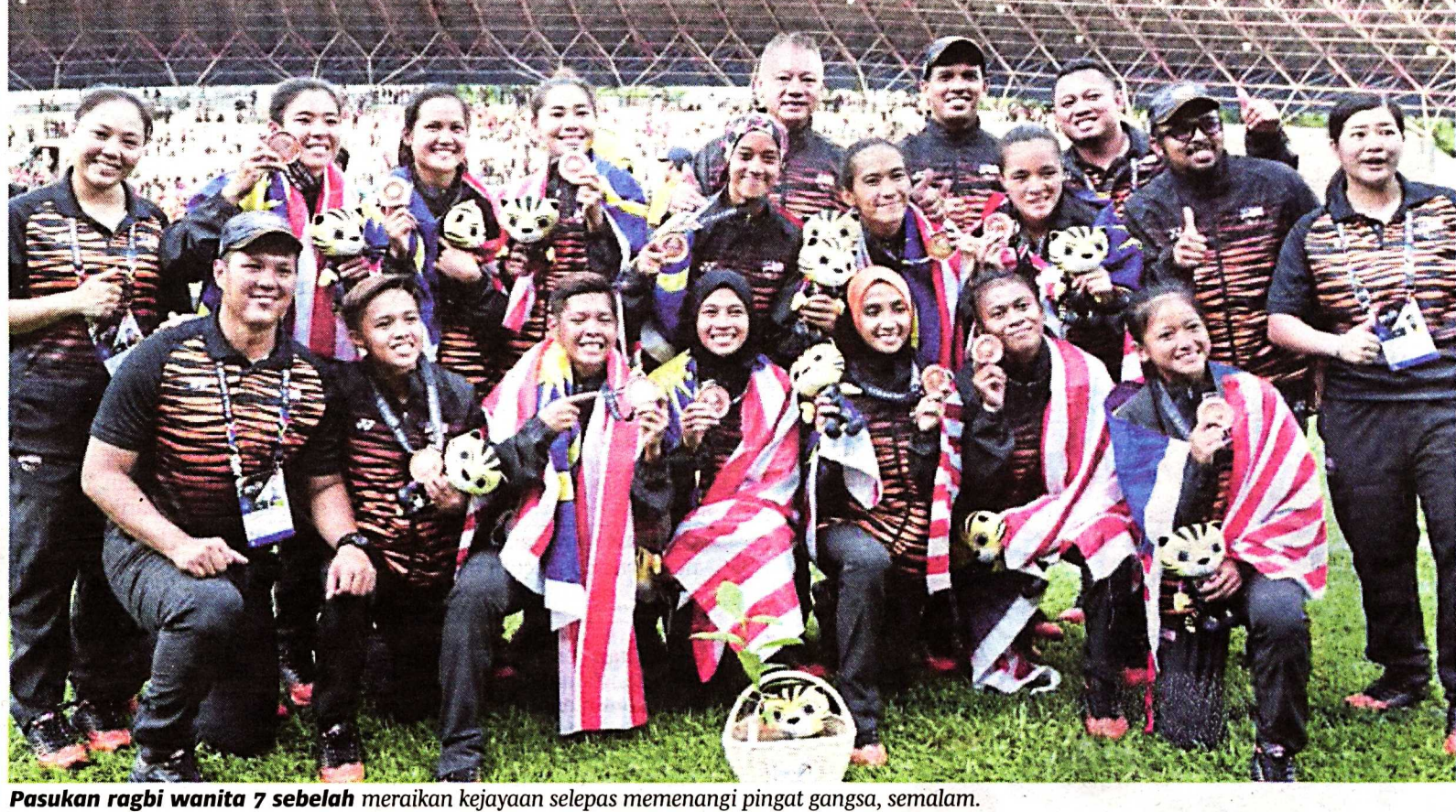
Pasukan ragbi wanita 7 sebelah meraikan kejayaan selepas memenangi pingat gangsa, semalam.