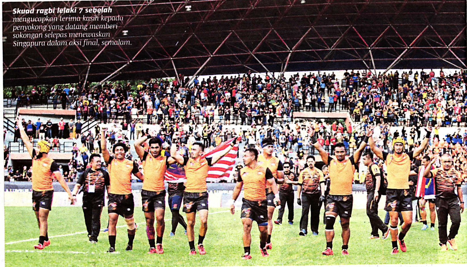
Skuad ragbi lelaki 7 sebelah mengucapkan terima kasih kepada penyokong yang datang memberi sokongan selepas menewaskan Singapura dalam aksi final, semalam.