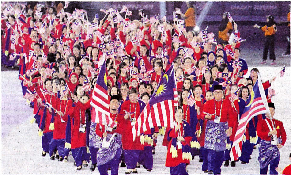
PERARAKAN masuk kontinjen Malaysia pada pembukaan Sukan SEA Kuala Lumpur 2017 (KL2017) di Stadium Nasional Bukit Jalil, Kuala Lumpur, Sabtu lalu.

Jadi sudah semestinya persoalan utama sekarang yang berlegar dalam pemikiran setiap rakyat adalah apakah kita mampu mengulangi sejarah 2001 untuk muncul sebagai juara keseluruhan Sukan SEA? Ini kerana kita tidak mahu sekadar menjadi penganjur yang hebat tetapi gagal bangkit