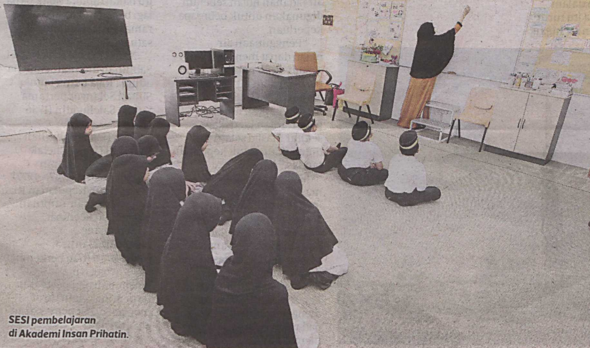
SESI pembelajaran di Akademi Insan Prihatin.