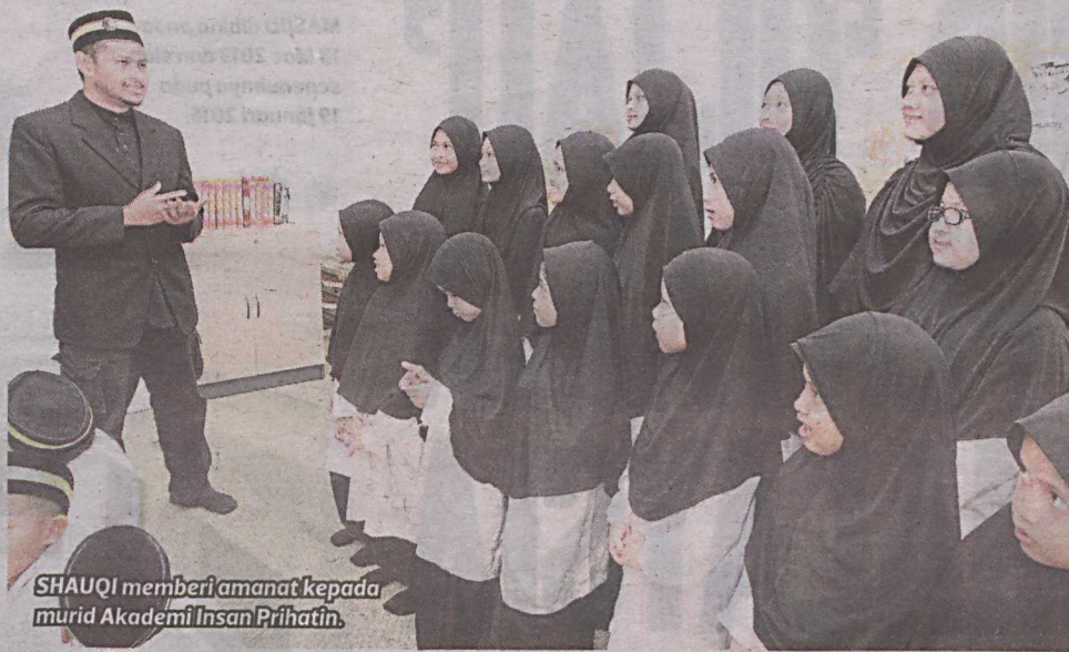
SHAUQI memberi amanat kepada murid Akademi Insan Prihatin.

“Itu pendorong utama saya menjadi sukarelawan sepenuh masa di RPWP dan apa yang saya lakukan ini bukan ganjaran diri saya semata-mata malah saham akhirat kepada kedua ibu bapa saya,” katanya.