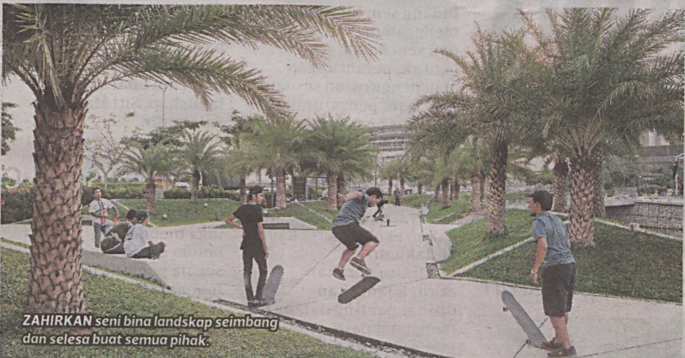
ZAHIRKAN seni bina landskap seimbang dan selesa buat semua pihak.