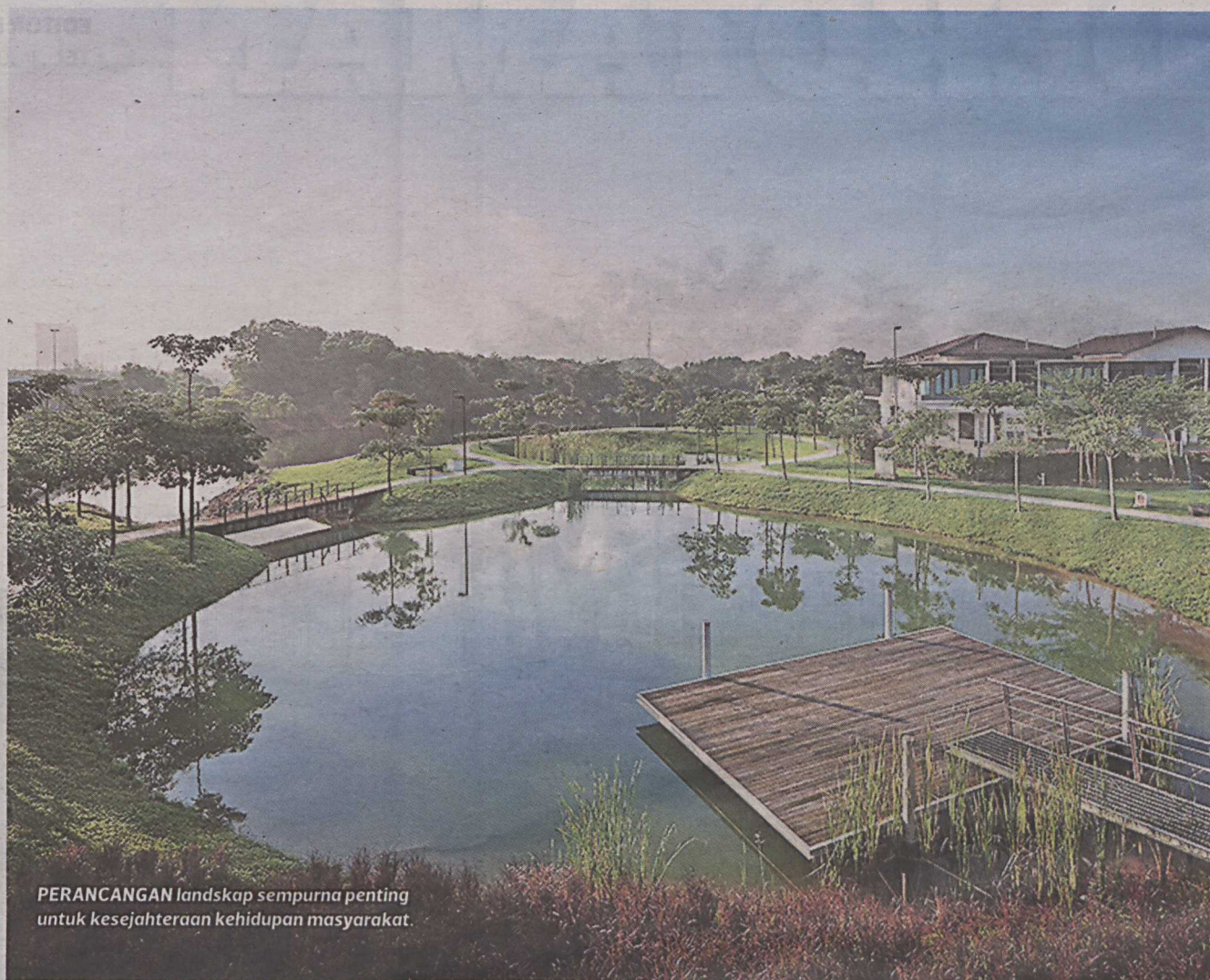
PERANCANGAN landskap sempurna penting untuk kesejahteraan kehidupan masyarakat.

Ia menerusi perancangan dan reka bentuk yang inovatif menyediakan persekitaran hidup lebih