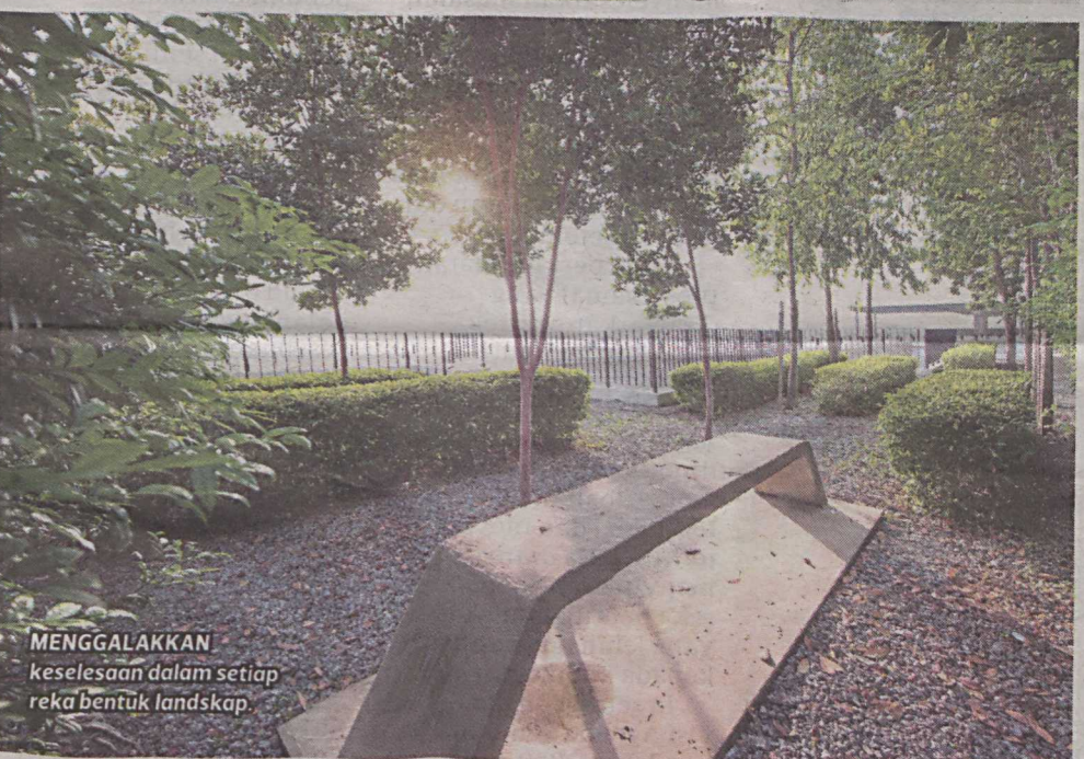
MENGALAKKAN keselesaan dalam setiap reka bentuk landskap.