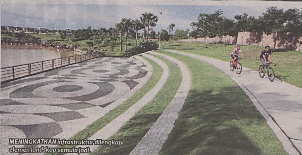
MENINGKATKAN infrastruktur dilengkapi elemen landskap semula jadi.