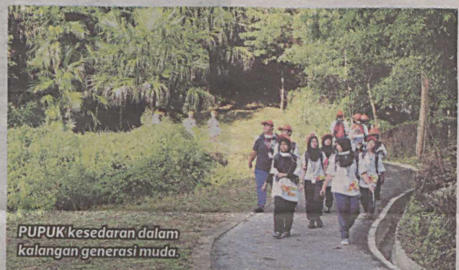
PUPUK kesedaran dalam kalangan generasi muda.

“Seterusnya industri seni bina landskap perlu memberi tumpuan kepada pembangunan kepimpinan, meningkatkan produktiviti,