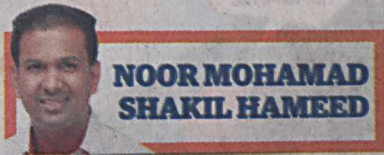
NOOR MOHAMAD SHAKIL HAMEED

P ENDEDAHAN pihak Kementerian Pendidikan baru-baru ini bahawa sebanyak 402 buah sekolah menengah dan rendah di negara ini sedang dalam pemerhatian berikutan isu disiplin pelajar wajar diberi perhatian serius. Walaupun bilangan sekolah itu kecil berbanding jumlah keseluruhan sekolah di Malaysia yang lebih dari 10,000 buah tetapi jika kita gagal bertindak segera kemungkinan besar masalah disiplin di sekolah terbabit akan bertambah teruk dan merebak ke sekolah lain.