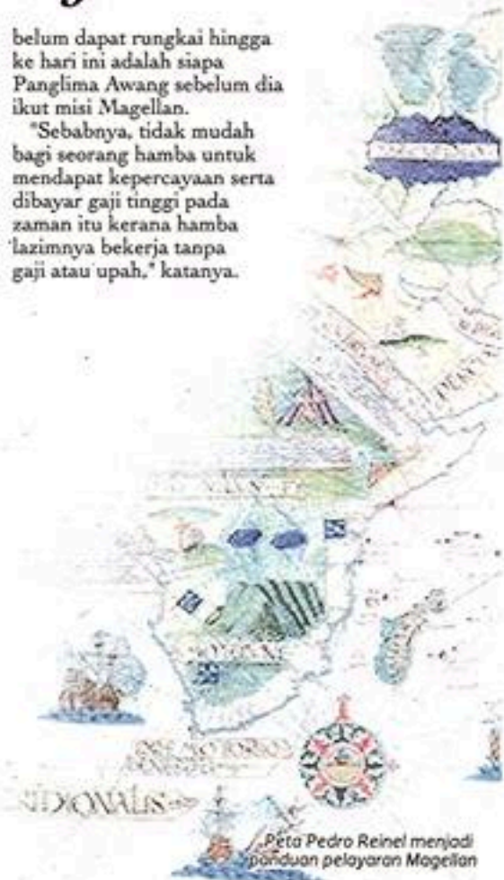
Peta Pedro Reinel menjadi panduan pelayaran Magellan

"Sebabnya, tidak mudah bagi seorang hamba untuk mendapat kepercayaan serta dibayar gaji tinggi pada zaman itu kerana hamba lazimnya bekerja tanpa gaji atau upah," katanya.