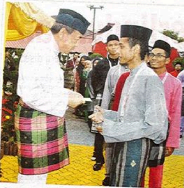
Penuntut UPM yang menerima sumbangan duit raya berjumlah RM300 seorang.