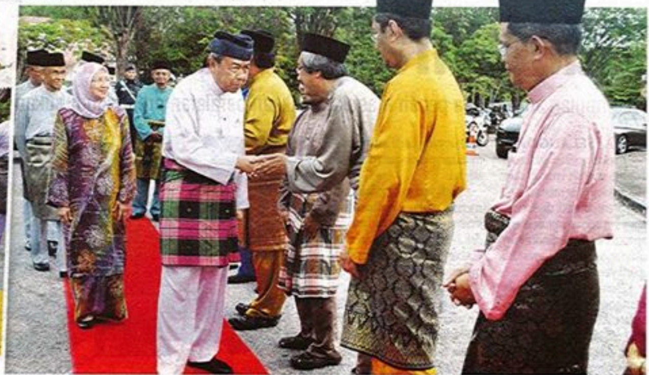
Warga UPM menyambut keberangkatan tiba Sultan Sharafuddin, semalam.