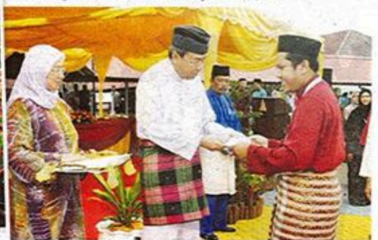
Sultan Sharafuddin berkenan menyampaikan sumbangan Dermasiswa Penyelidikan dan Wakaf Ilmu UPM kepada penerima.