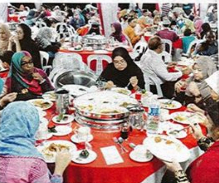
Penuntut menikmati hidangan berbuka puasa yang disediakan.