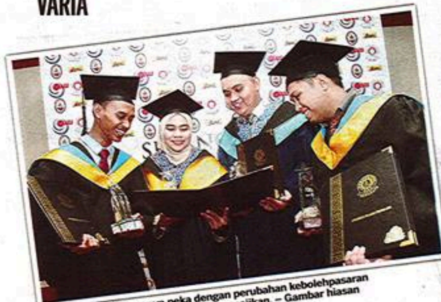
PARA pelajar seharusnya peka dengan perubahan kebolehpasaran graduan terkini agar menjadi rebutan majikan. – Gambar hiasan