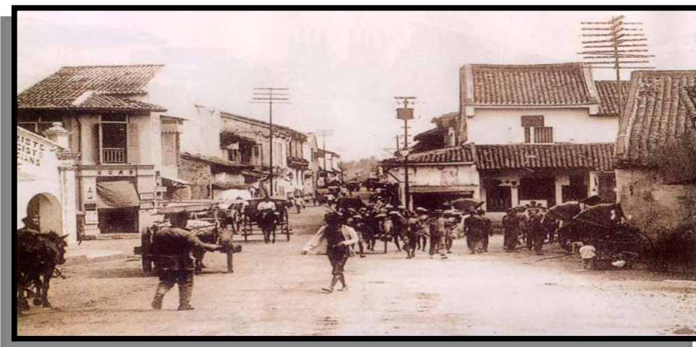
Rajah 1.2 : Pemandangan bandar Melaka pada kurun 18. Sumber : Badryah Hj. Salleh, “Nostalgia for Old Melaka”. Heritage Asia, 2003.

Menurut Ghafar (2003), bandar yang dikategorikan sebagai bandar warisan di Malaysia ialah bandar George Town, bandar Melaka, Kuala Lumpur, Kota Bharu, Kuching dan Taiping. Ia diklasifikasikan mengikut tahun ia dibuka dan mengikut banciaan bangunan lama yang terdapat di bandar seperti yang tercatat di dalam Akta Benda Purba 1976. Pihak Muzium dan Antikuiti Negara bertanggungjawab dalam aktiviti konservasi monumen lama dan bersejarah yang berumur 100 tahun. Nilai seni bina, sejarah dan budaya atau added value yang terdapat pada bangunan dan persekitaran bandar merupakan aset negara yang amat berharga. Pemandangan dalam Rajah 1.2 menunjukkan bandar sebagai pusat berkembangnya aktiviti sosial dan ekonomi dan aktiviti pada kurun ke 18. Persekitaran bandar seperti ini mampu mengembalikan nostalgia zaman dahulu untuk tatapan generasi masa depan. Bangunan lama juga masih boleh diubah suai mengikut kesesuaian penggunaannya pada zaman moden dengan menggunakan kaedah suai guna seperti bangunan Carcosa Seri Negara yang di tukar kegunaannya daripada kediaman rasmi menjadi hotel eksklusif.