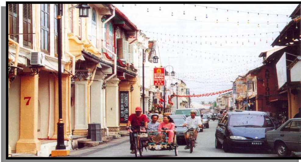
Rajah 1.4 : Menaiki beca mengelilingi bandar.

Konservasi bandar merupakan penjagaan dan pengendalian warisan bandar daripada dimusnahkan atau diubah tanpa perancangan, pengawalan dan pengurusan yang sempurna lagi sistematik. Dalam konteks bandar warisan, fakta sejarah dan latar belakang sesuatu peninggalan seni bina memainkan peranan yang penting di samping untuk tatapan generasi akan datang. Seperti dinyatakan di bahagian pengenalan, sesebuah negara itu perlu mempunyai karakter dan identiti yang kukuh supaya ia dikenali di seluruh dunia terutamanya dalam bidang pelancongan. Pelancong yang datang ke negara Malaysia dapat merasai pengalaman seperti zaman pemerintahan kolonial yang merupakan nostalgia seperti menaiki beca (Rajah 1.4).