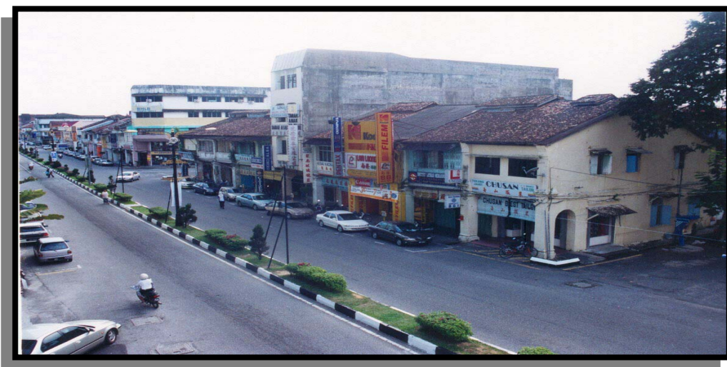
Rajah 1.5 : Rumah kedai lama di Jalan Kota.

Pada tahun 1880an, bandar Taiping amat terkenal dengan gelaran ‘ Chinese town ’ kerana majoriti penghuninya adalah masyarakat China. Aktiviti seperti perniagaan dan sosial yang belaku sehingga ke hari ini merupakan warisan peninggalan daripada nenek moyang zaman pemerintahan kolonial. Pemandangan rupa bandar yang berubah merupakan salah satu sebab mengapa konservasi bandar perlu diaplikasikan dan dimasukkan ke dalam agenda pembangunan PBT. Persekitaran bandar seperti ini memberikan gambaran bahawa konservasi bandar penting bagi pemeliharaan identiti, karakter dan memastikan pembangunan bandar dikawal. Persoalan seperti ketidakseragaman bangunan rumah kedai lama dan moden (Rajah 1.5) yang menjejaskan kualiti visual dan skyline bandar tidak akan timbul jika sesebuah bandar mengamalkan Pelan Konservasi yang baik.