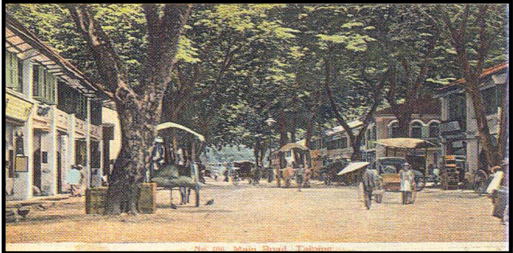
Rajah 1.1 : Aktiviti perniagaan di Jalan Taming Sari (Main Road).