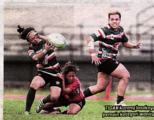
TIDAK kurang lasaknya pemain kategori wanita.

Malaysia dipertemukan dalam perlawanan kali ini. Mereka dalam perlawanan kali ini ialah barisan atlet premier atau paling kurang divisyen dua.