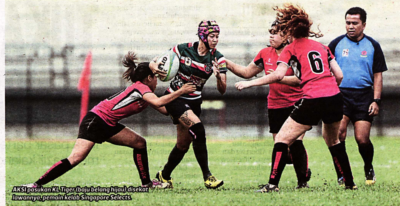
AKSI pasukan KL Tiger (baju belang hijau) disekat lawannya, pemain kelab Singapore Selects.

"Kami banyak kehilangan penguasaan permainan sehingga ke minit terakhir kami hanya mampu menyamakan kedudukan. Boleh dikatakan 14 minit sepanjang bersama