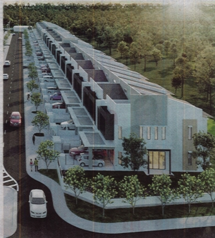
RESIDENSI Sungai Purun dikelilingi kehijauan alam dan berdekatan dengan prasarana moden serba lengkap.