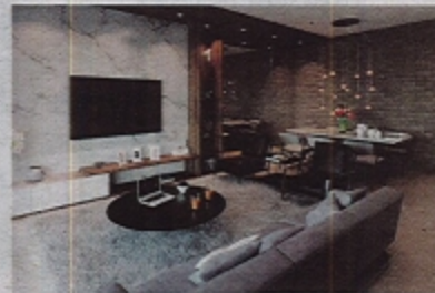
RESIDENSI Sungai Purun menawarkan reka bentuk dalaman yang luas dan selesa.

Portfolio pelaburannya memberi tumpuan kepada industri utiliti dan hartanah, di dalam dan di luar negara.