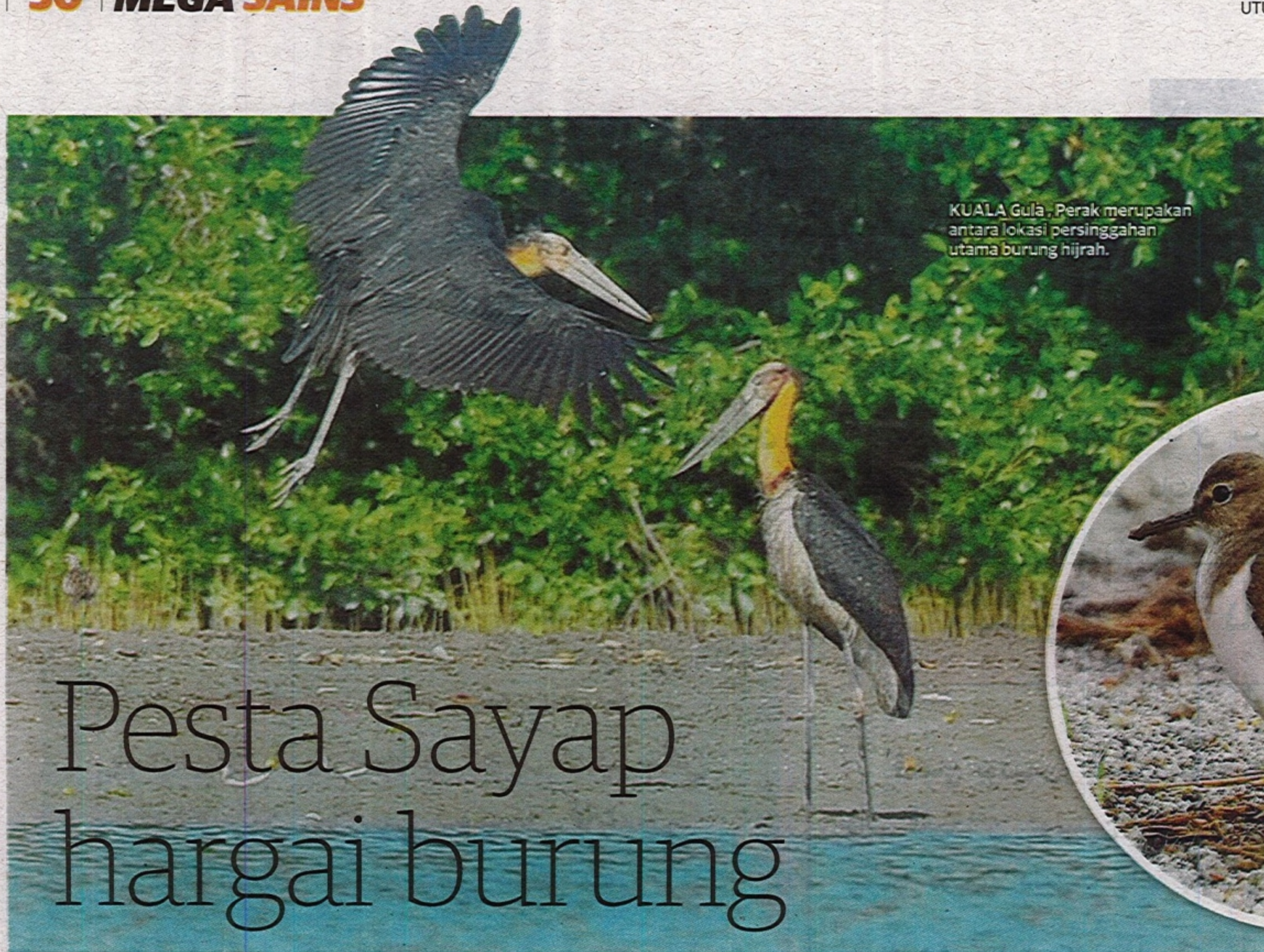
KUALA Gula, Perak merupakan antara lokasi persinggahan utama burung hijrah.