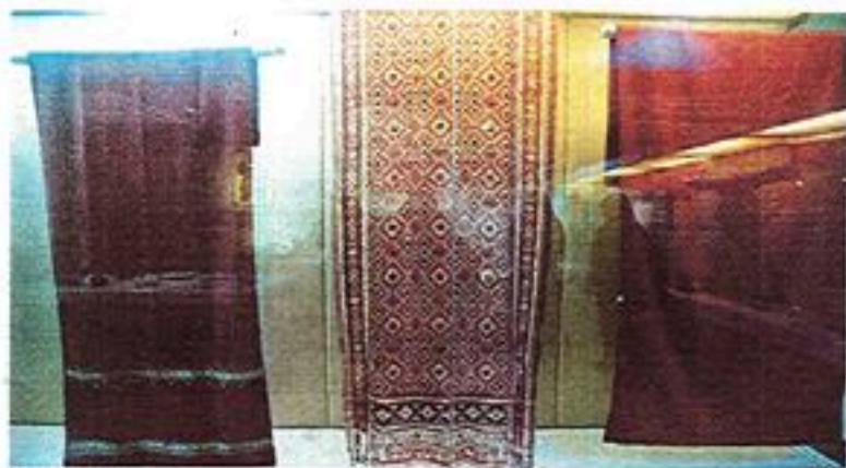
KAIN cindai ditenun menggunakan serat nanas atau sutera halus menggunakan teknik ikatan berganda.

terbabit yang dikatakan dari 'kayangan' dan turun ke bumi untuk mati.