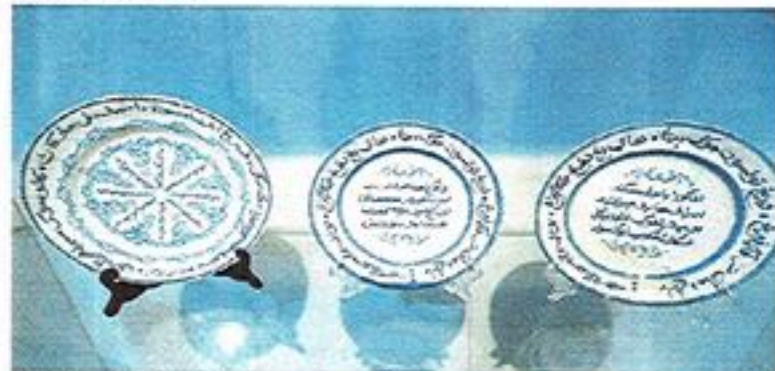
PINGGAN dengan hiasan pantun nasihat.