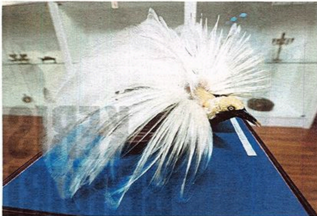
BURUNG cenderawasih yang dikatakan dari kayangan.

Menurutnya, muzium berkenaan yang terletak di Fakulti Bahasa Moden dan Komunikasi menempatkan