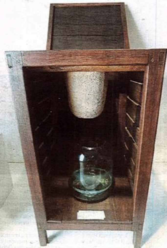
PENAPIS air tradisional.

Menurutnya, banyak mitos mengaitkan haiwan