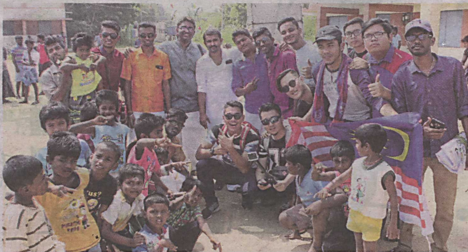
Sesi beramah mesra bersama penduduk setempat.