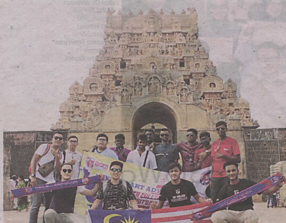
Pelajar mengadakan lawatan ke kuil yang terdapat di India untuk melihat keindahan seni bina yang dimiliki.

"Saya gembira kerana dapat membantu masyarakat yang susah di sana dan melahirkan rasa syukur kepada Allah kerana rakyat Malaysia dapat hidup senang dan aman damai," katanya.