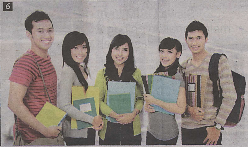
1. PEMBERIAN Perakuan Status Swaakreditasi Agensi Kelayakan Malaysia menjadi penanda aras bagi institusi yang menerimanya sekali gus meningkatkan lagi daya saing dalam penawaran program baru berkualiti. - Gambar hiasan