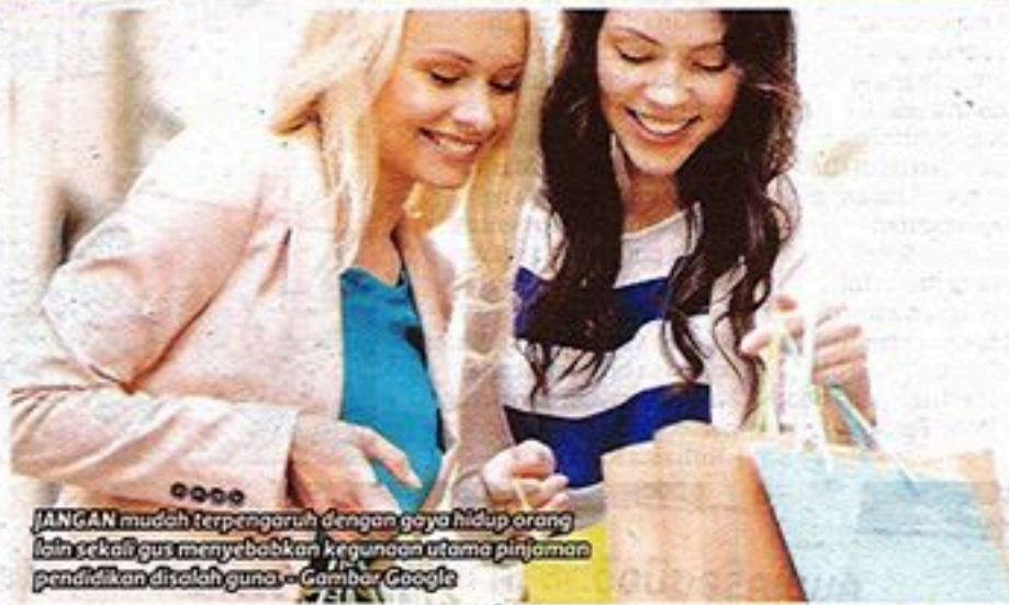
JANGAN mudah terpengaruh dengan gaya hidup orang lain sekiranya menyebabkan kegunaan utama pinjaman pendidikan disalah guna.

Antara langkah yang beliau sarankan untuk membantu siswa menjimatkan kos ialah perkongsian bersama rakan untuk memasak jika tinggal di luar asrama, mengurangkan pembelian barang tidak penting selain mengambil inisiatif melaksanakan kerja sampingan.