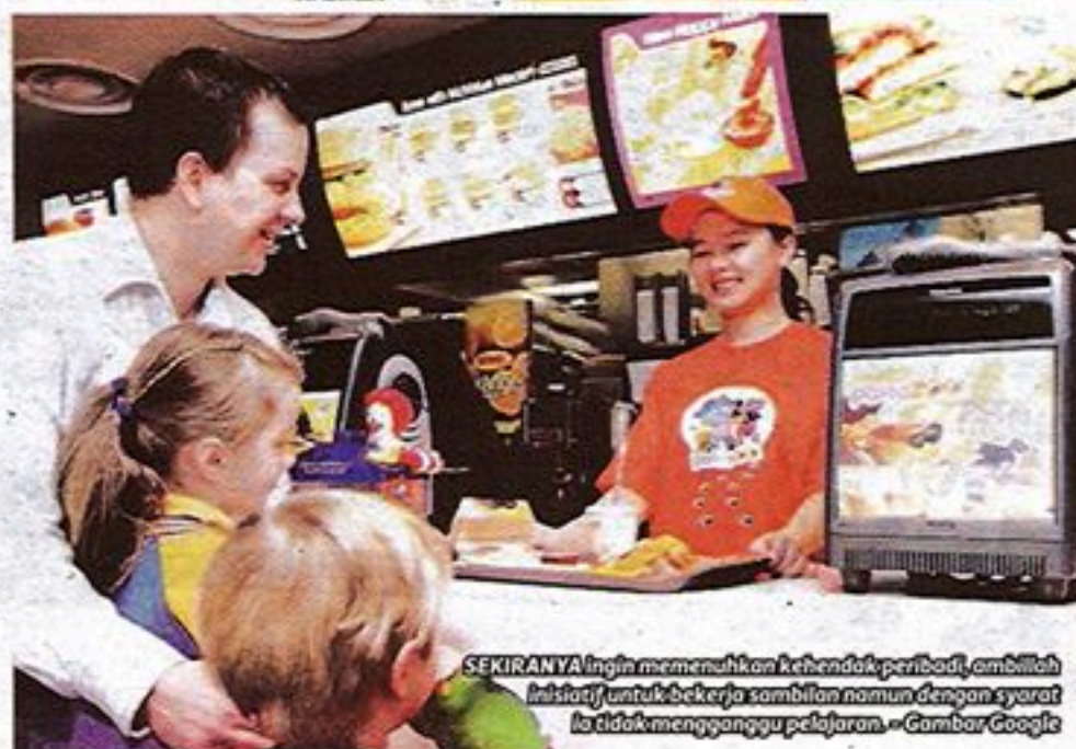
SEKIRANYA ingin memenuhi kehendak peribadi, ambillah inisiatif untuk bekerja sambil namun dengan syarat ia tidak mengganggu pelajaran. - Gambar Google