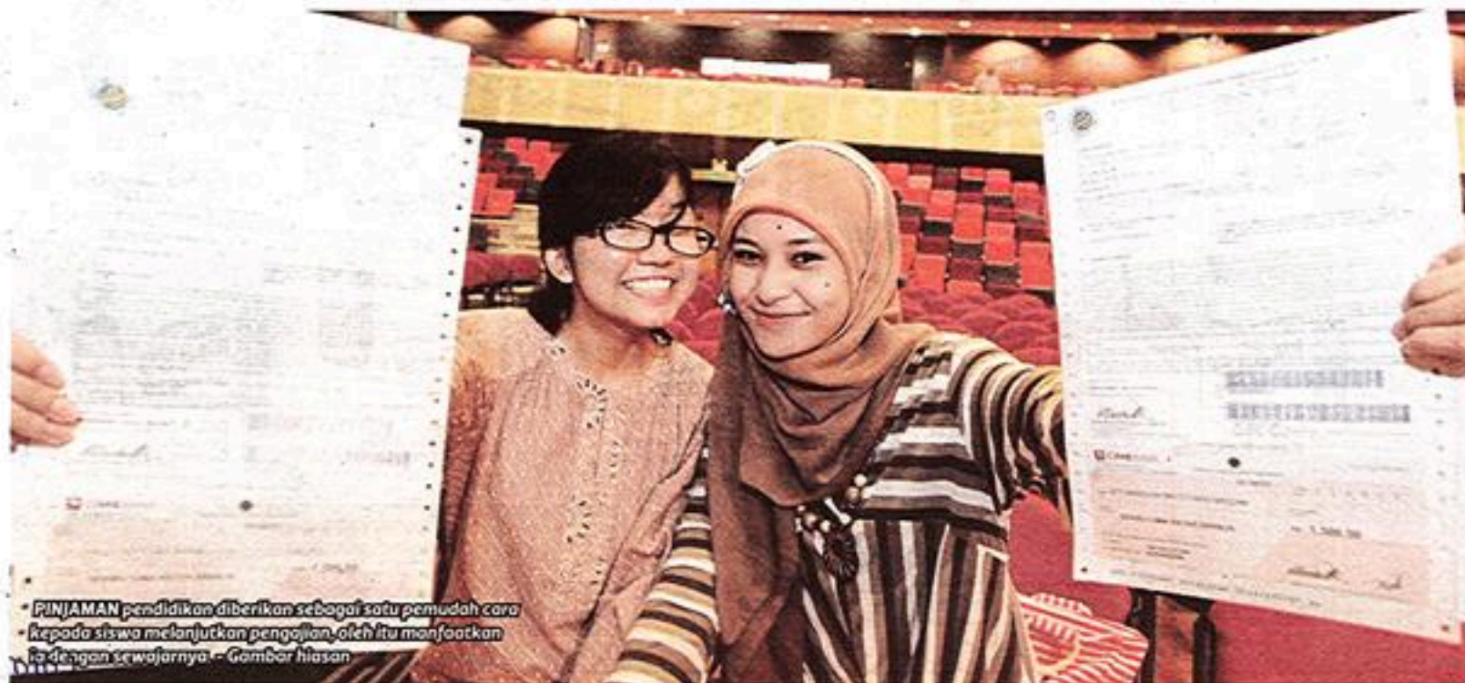
PINJAMAN pendidikan diberikan sebagai satu pemudah cara kepada siswa melanjutkan pengajian. Oleh itu manfaatkan ia dengan sewajarnya. - Gambar hiasan

"Seperti mencari kerja pada hujung minggu atau cuti semester dan duit diperolehi itu boleh menampung atau