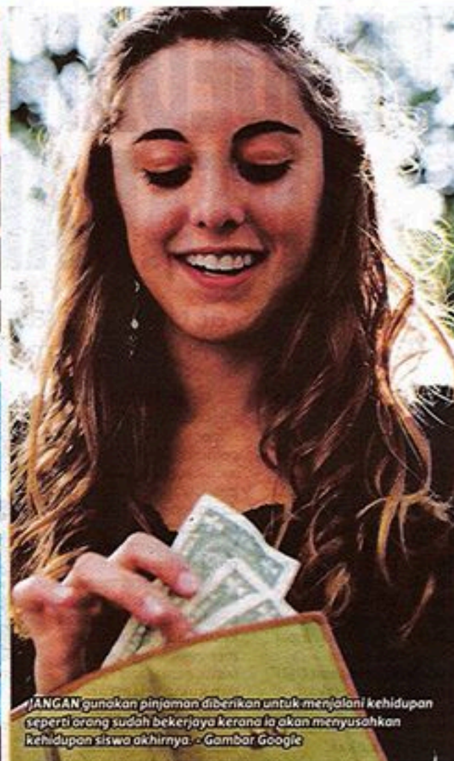
JANGAN gunakan pinjaman diberikan untuk menjalani kehidupan seperti orang sudah bekerja kerana ia akan menyusahkan kehidupan siswa akhirnya.