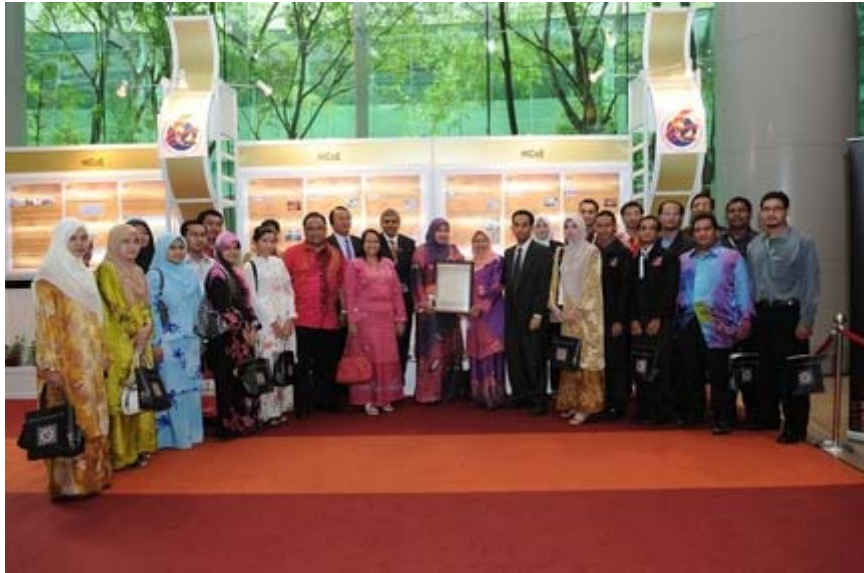
Warga Institut Biosains yang berjaya diiktiraf sebagai Pusat Kecermelangan Pengajian Tinggi (HICoE)

“Peruntukan yang diberikan adalah untuk membantu melonjakkan pencapaian HICoE ke peringkat antarabangsa dari segi kualiti penyelidikan, perolehan akreditasi prasarana fizikal serta peluasan jaringan dengan industri tempatan mahupun institusi antarabangsa,” katanya pada majlis pelancaran Majlis Profesor Negara dan Pusat Kecermelangan Pengajian Tinggi (HICoE) di Pusat Konvensyen Antarabangsa Putrajaya (PICC).