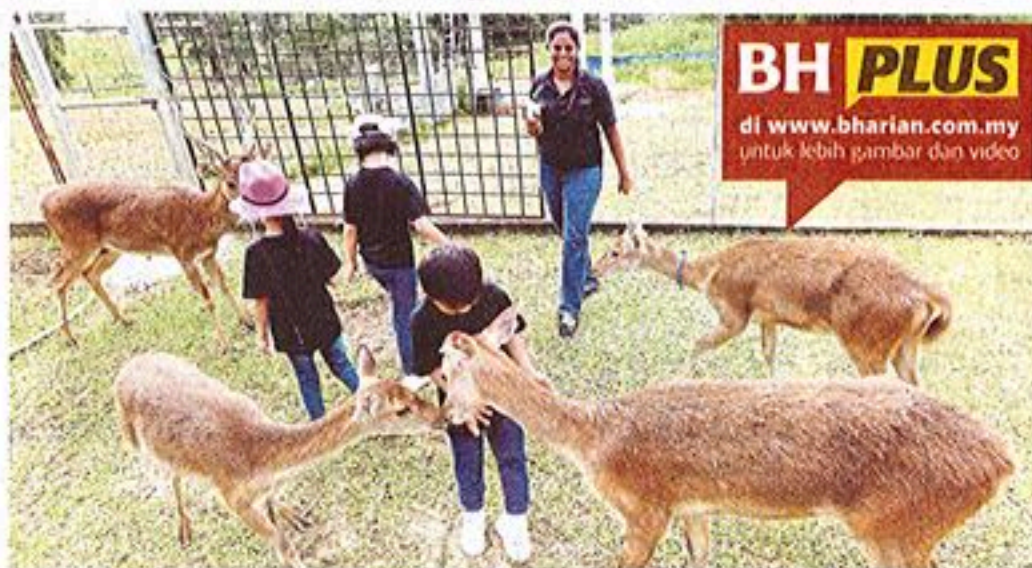
Pengunjung seronok dapat mendekati rusa di Ladang 16 UPM.