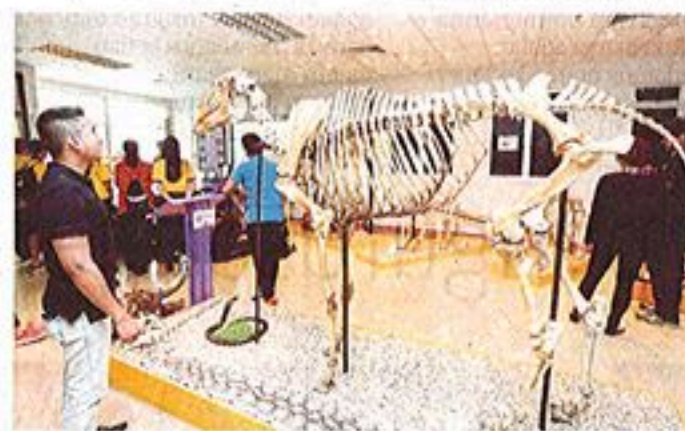
Pelawat melihat rangka haiwan yang dipamerkan di Muzium Anatomi Haiwan.