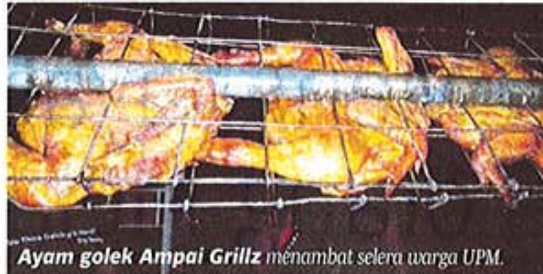
Ayam golek Ampai Grillz menambat selera warga UPM.