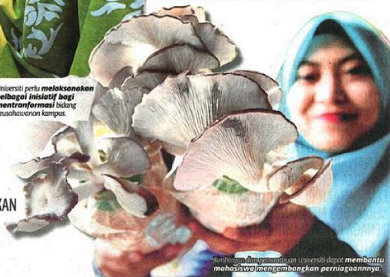
Bimbingan dan pemantauan universiti dapat membantu mahasiswa mengembangkan perniagaannya.

Pengarah Pusat Pembangunan Keusahawanan Dan Kebolehpasaran Graduan (CEM) Universiti Putra Malaysia (UPM)