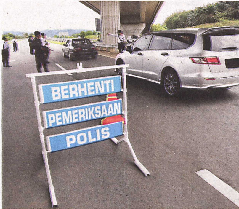
ANGGOTA polis trafik menahan kenderaan yang dikesan dipandu melebihi had laju dalam operasi had laju dan pelbagai kesalahan lain di LPT2, Kemaman, Terengganu, hujung tahun lalu. - GAMBAR HIASAN

Namun hakikatnya kemalangan maut terus berlaku malah mencatatkan kadar peningkatan yang merisaukan. Justeru timbul persoalan apakah dengan menaikkan kadar kompaun kita dapat menyelesaikan dan mengatasi masalah pokok iaitu sikap pemandu sekali gus mengurangkan kadar kemalangan? Sekali lagi secara jujurnya baik penulis mahupun kalangan pakar dan juga majoriti anggota masyarakat terpaksa mengatakan bahawa kenaikan kadar kompaun belum mampu menyelesaikan masalah pokok yang kita sedang hadapi. Hal ini kerana yang degil tetap akan terus degil dan sama ada membayar apa saja jumlah kompaun baharu yang dikenakan ataupun langsung tidak peduli dan