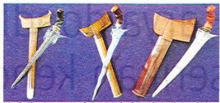
Keris Charita Keris Bugis Luk 9 Keris Bugis Sepokal