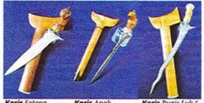
Keris Sotong Keris Anak Alang Guling Keris Bugis Luk 5

Oleh Faizatul Farhana Farush Khan ffarhana@bh.com.my Serdang