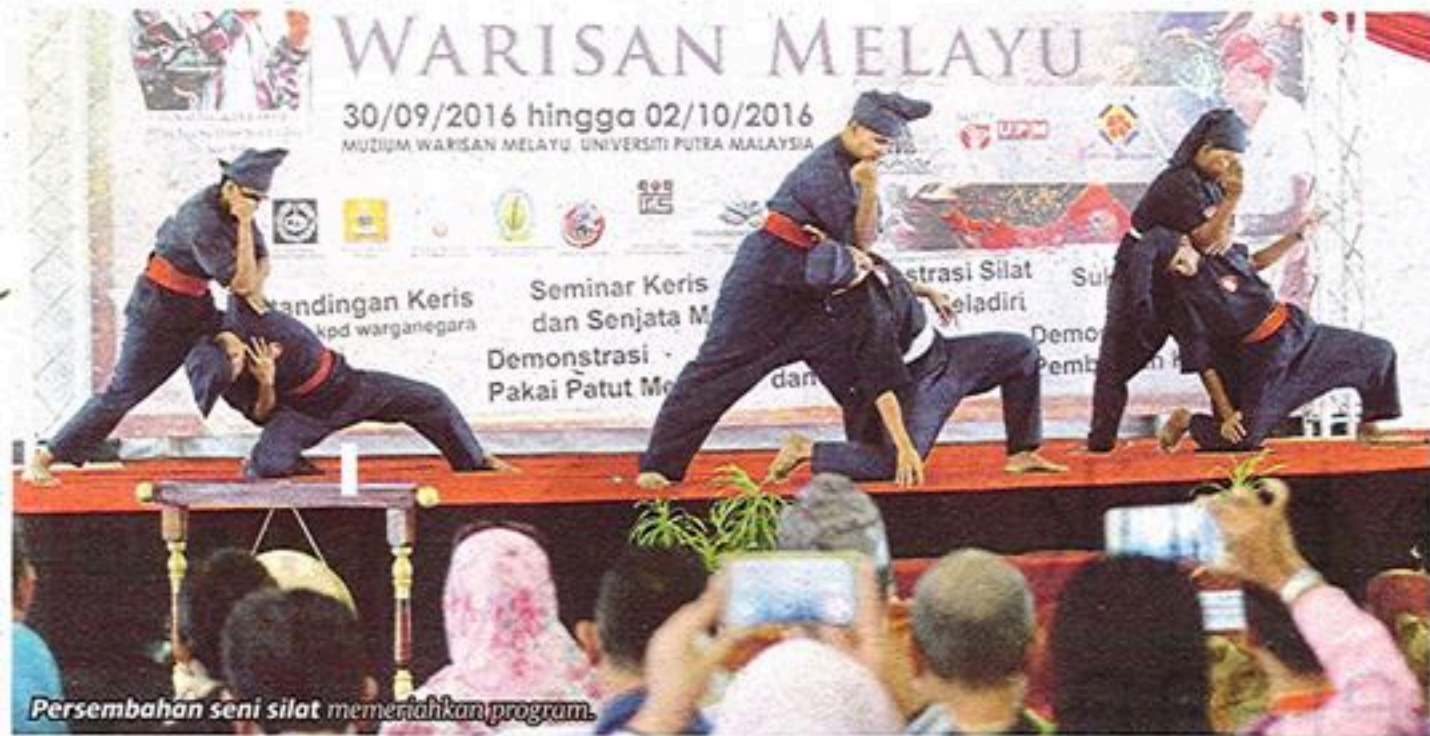
Persembahan seni silat memeriahkan program.