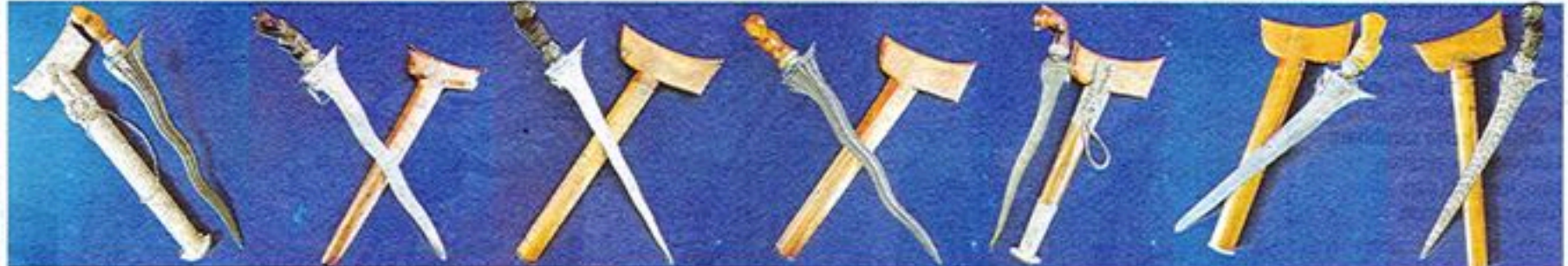
Keris Melayu Sumatera Luk 5 Keris Palembang Luk 5 Keris Chenok Luk 9 Keris Malela Luk 5 Keris Bugis Luk 3 Keris Sepokal Lurut Keris Beko