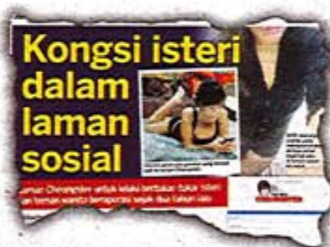
KERATAN Kosmo! semalam.

Kosmo! semalam melaporkan laman web Cheongster yang