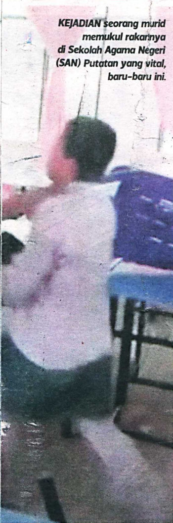
KEJADIAN seorang murid memukul rakannya di Sekolah Agama Negeri (SAN) Putatan yang vital, baru-baru ini.