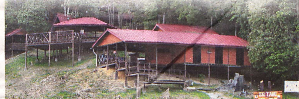
ANTARA kemudahan yang disediakan di Kem Sungai tiang, Hutan Simpan Royal Belum, Grik, Perak.