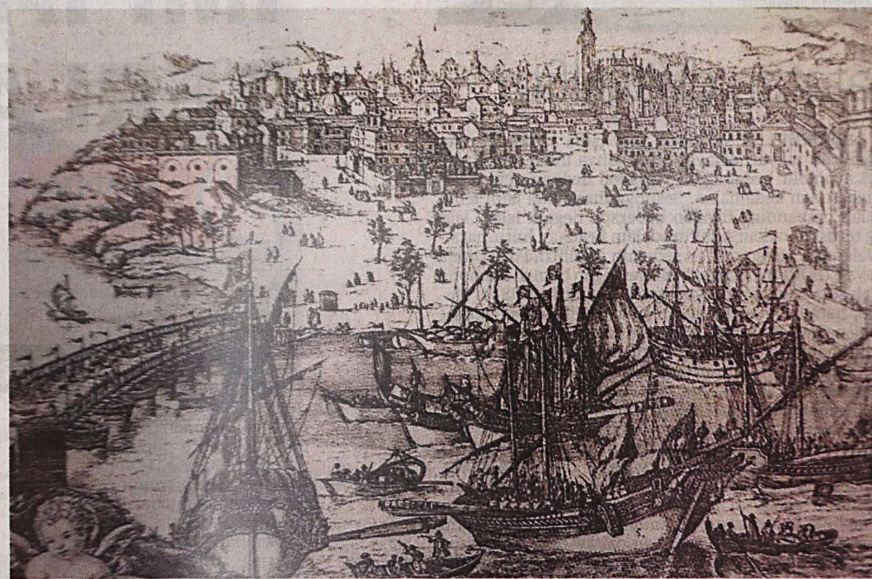
GAMBARAN kesibukan pelabuhan Seville pada abad ke-15 iaitu lokasi yang pernah disinggahi Ferdinand Magellan dan Enrique.

Terdapat sekurang-kurangnya dua dokumen arkib yang dapat