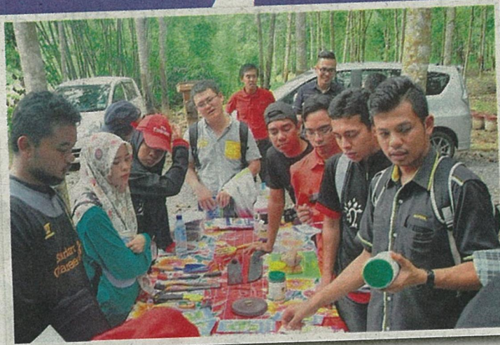
PESERTA diberi penerangan tentang peralatan yang digunakan pekebun getah.