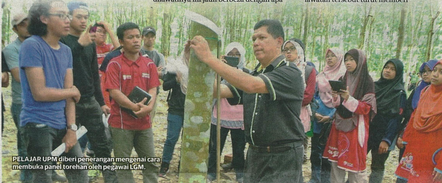
PELAJAR UPM diberi penerangan mengenai cara membuka panel torehan oleh pegawai LGM.