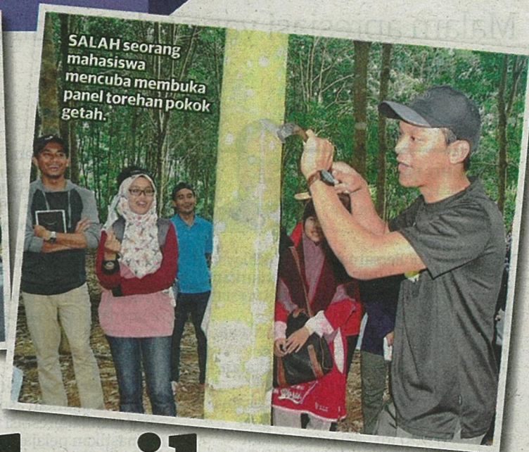
SALAH seorang mahasiswa mencuba membuka panel torehan pokok getah.