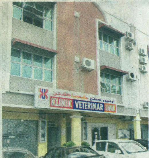
BANGUNAN Fakulti Perubatan Veterinar, UMK.