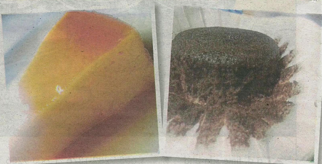
Puding karamel dan muffin diperbuat daripada bahan bebas tepung gandum .