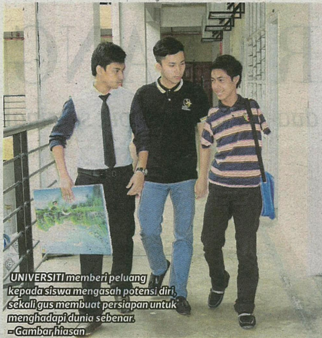
UNIVERSITI memberi peluang kepada siswa mengasah potensi diri, sekali gus membuat persiapan untuk menghadapi dunia sebenar. - Gambar hiasan

“Amat penting untuk menggunakan kesempatan selama empat tahun diberikan ini bagi melengkapkan diri dengan keperluan