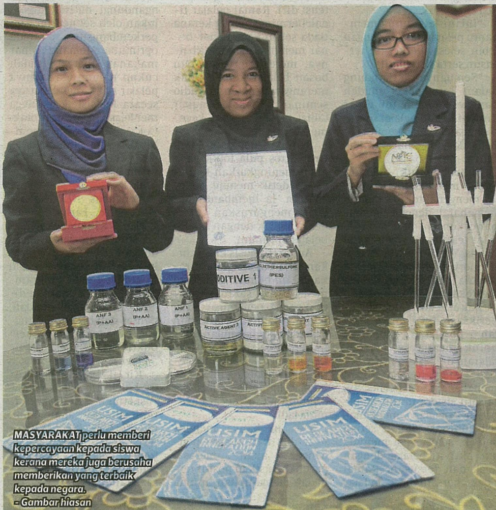
MASYARAKAT perlu memberi kepercayaan kepada siswa kerana mereka juga berusaha memberikan yang terbaik kepada negara. - Gambar hiasan