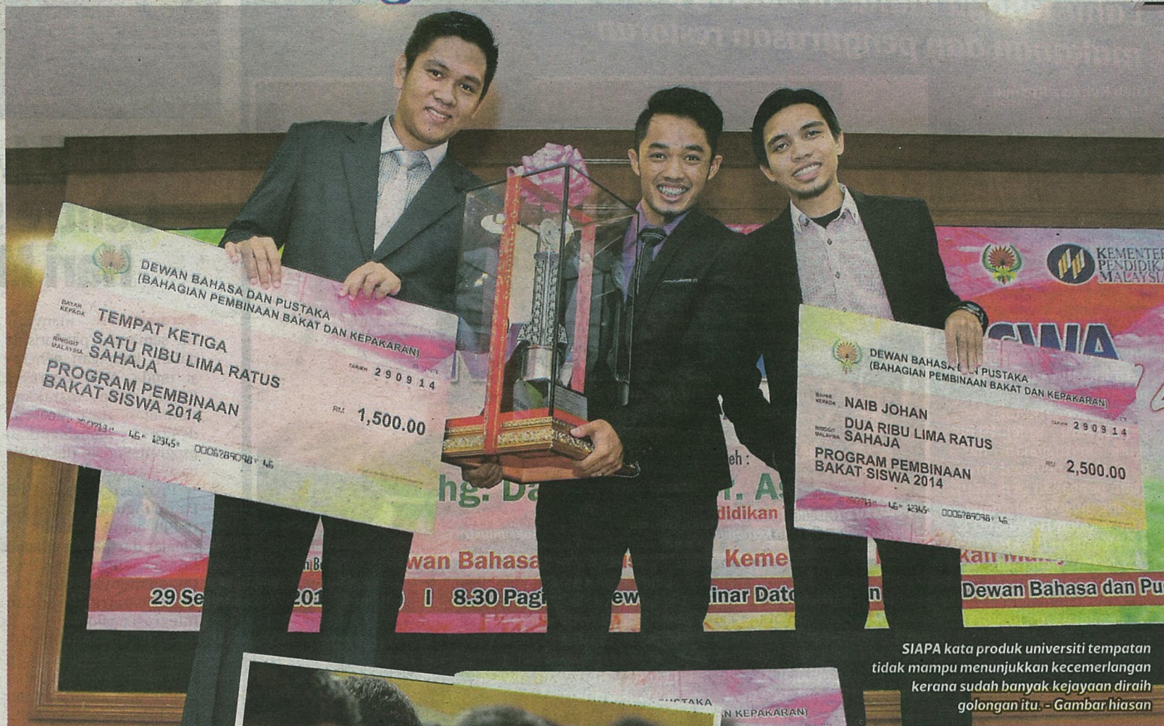
SIAPA kata produk universiti tempatan tidak mampu menunjukkan kecemerlangan kerana sudah banyak kejayaan diraih golongan itu. - Gambar hiasan

"Kita ada senarai panjang mereka yang berjaya. Justeru, bagaimana boleh mendakwa golongan itu kurang kualiti, kurang cemerlang dan sebagainya?"