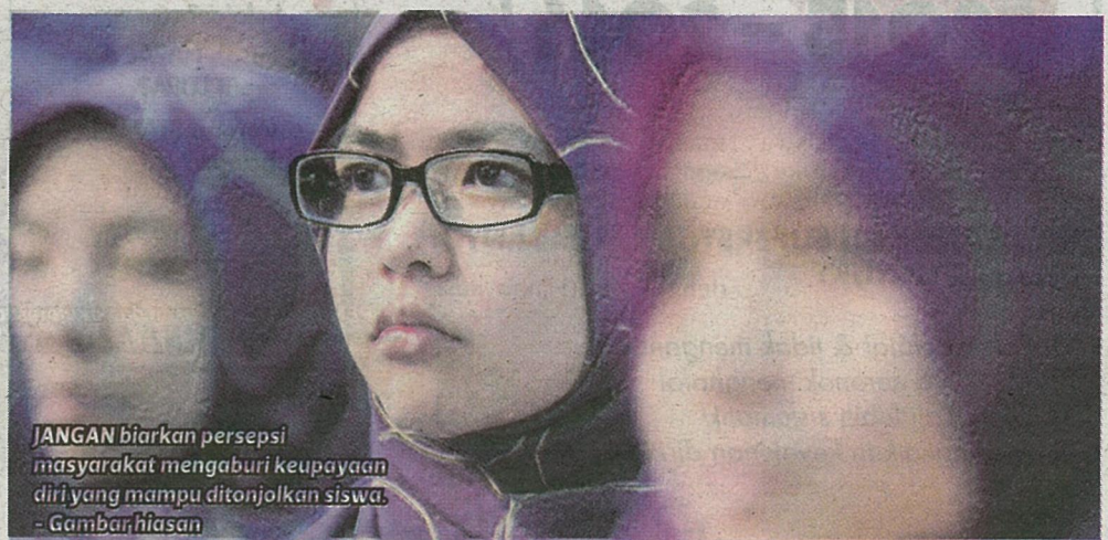
JANGAN biarkan persepsi masyarakat mengaburi keupayaan diri yang mampu ditonjolkan siswa. - Gambar hiasan