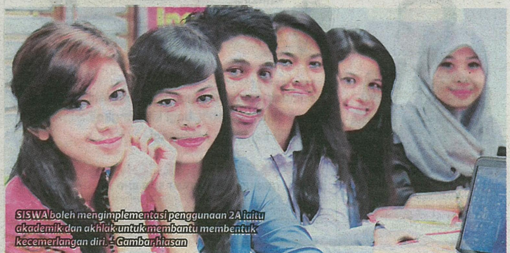
SISWA boleh mengimplementasi penggunaan 2A iaitu akademik dan akhlak untuk membantu membentuk kecemerlangan diri. - Gambar hiasan