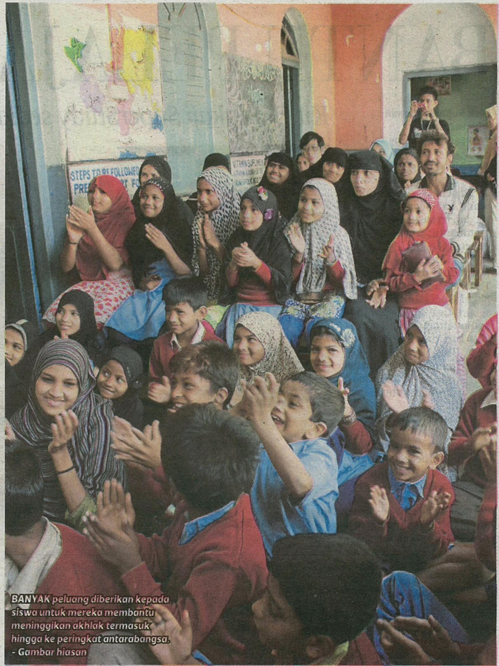
BANYAK peluang diberikan kepada siswa untuk mereka membantu meninggikan akhlak termasuk hingga ke peringkat antarabangsa.