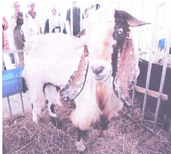
ORANG ramai melihat seekor kambing Pejantan Unggul Jamnapari Tulin yang dipamerkan di MAHA 2008, Serdang, semalam.

Headline Ratu Cantik Tok Janggut Date 13. Aug 2008 Media Title Utusan Malaysia