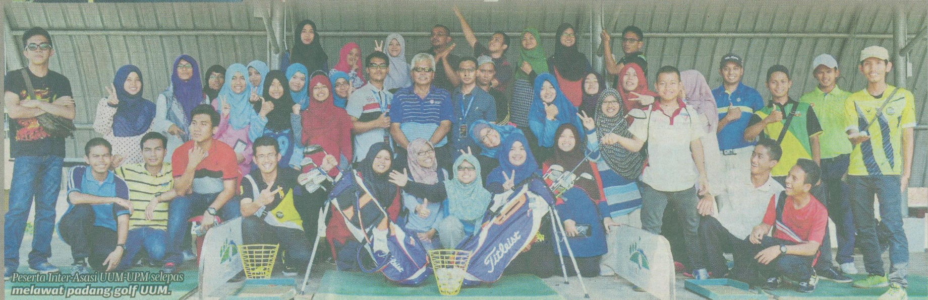
Peserta Inter-Asasi UUM-UPM selepas melawat padang golf UUM.

Setelah penat mengerah minda, katanya, peserta turut meluangkan masa beriadah di U-Assist, Lapang Sasar Memanah dan Akademi Golf Nasional UUM sambil menikmati suasana kehijauan sekitar kampus