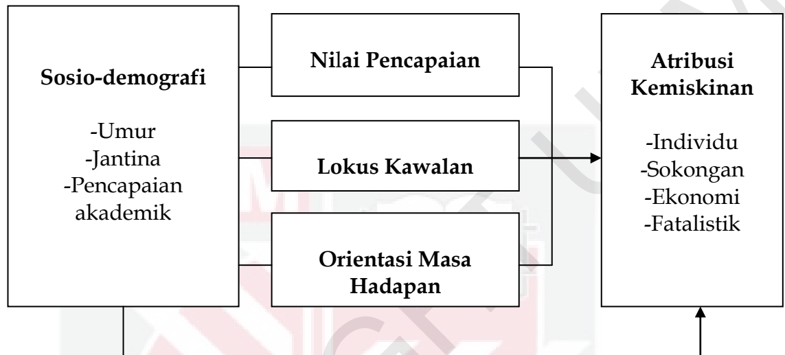
Rajah 1.3 Kerangka Konsep: Nilai Pencapaian, Lokus Kawalan, Orientasi Masa Hadapan dan Atribusi Kemiskinan

kawalan dan orientasi masa hadapan dengan atribusi kemiskinan. Pemboleh ubah antisiden bagi kajian ini ialah latar belakang atau sosio-demografi responden yang meliputi umur, jantina dan pencapaian akademik. Pemboleh ubah bebas adalah nilai pencapaian, lokus kawalan dan orientasi masa hadapan. Manakala, pemboleh ubah bersandar terdiri daripada atribusi kemiskinan yang mempunyai empat dimensi iaitu individu, sokongan, ekonomi dan fatalistik.