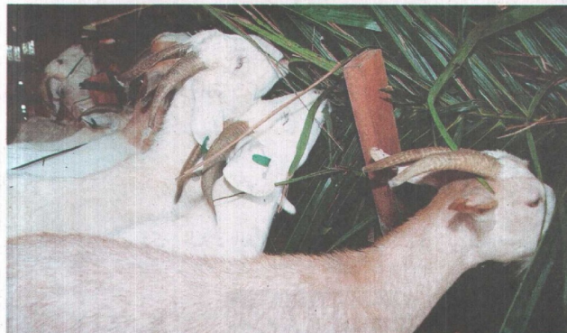
TERNAKAN kambing kini dipromosi secara hebat oleh Kementerian Pertanian dan Industri Asas Tani.

U TUSAN Malaysia dan sisipannya, Mega, sekali lagi berganding bahu dengan rakan strategiknya, Agro Bank dan Pusat Pengembangan, Keusahawanan dan Pemajuan Profesional (APEEC), Universiti Putra Malaysia