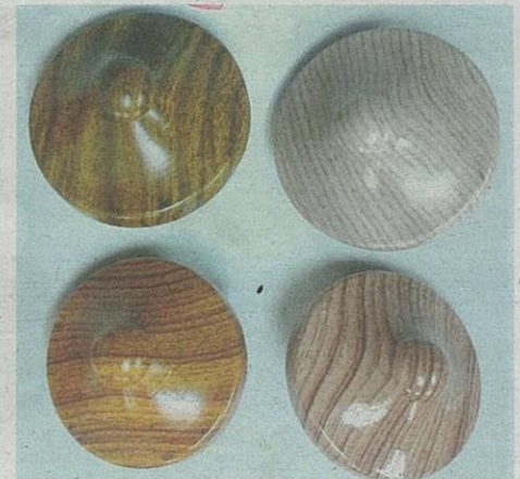
REKA bentuk gasing.

Gasing polimer mempunyai lebih ketahanan, keseragaman dan keselamatan