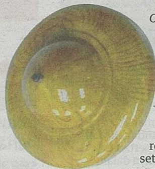
Championship 2014 di Klang Parade.

Pertandingan yang telah dijalankan menggunakan gasing plastik antaranya Festival Gasing 2013 di UPM, Festival Belia Malaysia 2014 dan MyGasing