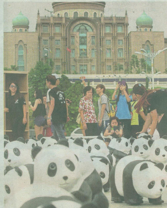
ORANG ramai mengambil peluang bergambar dengan patung panda.

tung panda ini dapat diteruskan pada masa akan datang, saya berharap dapat menyaksikannya lagi dan bergambar dengannya,” katanya.