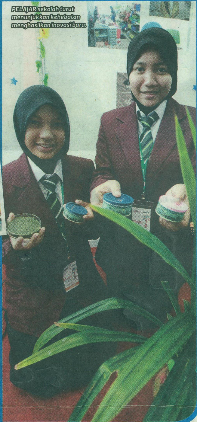
PELAJAR sekolah turut menunjukkan kehebatan menghasilkan inovasi baru.