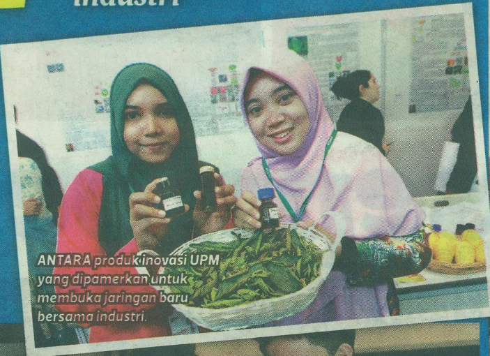
ANTARA produk inovasi UPM yang dipamerkan untuk membuka jaringan baru bersama industri.

L ebih 230 penyelid- ikan berimpak tinggi Universiti Putra Ma- laysia (UPM) dalam pel- bagai bidang dipamerkan pada Pameran Reka Cipta