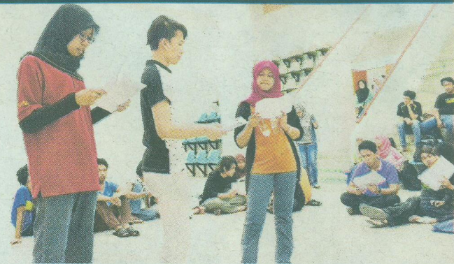
Aksi ahli kelab ketika sesi latihan teater .

"Penyertaan pelajar dalam teater menaikkan keyakinan diri, selain mengajar menguasai olahan tubuh