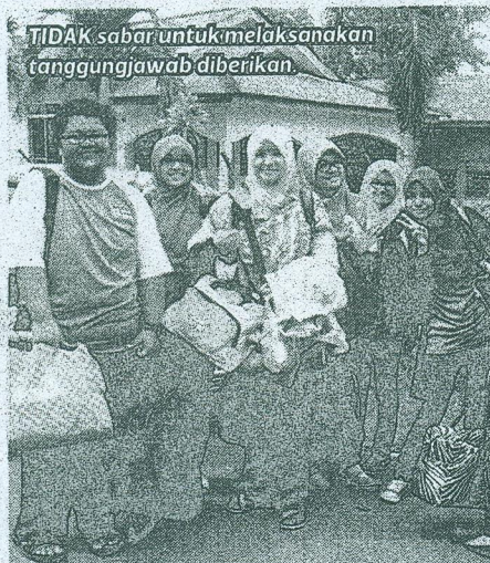
TIDAK sabar untuk melaksanakan tanggungjawab diberikan