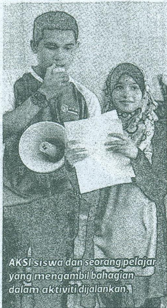
AKSI siswa dan seorang pelajar yang mengambil bahagian dalam aktiviti dijalankan