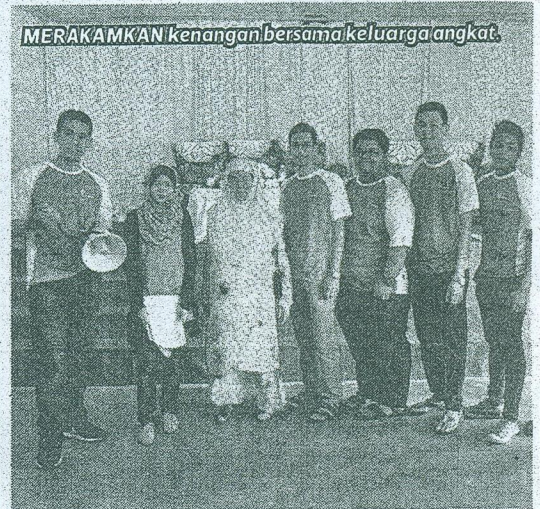
MERAKAMKAN kenangan bersama keluarga angkat.