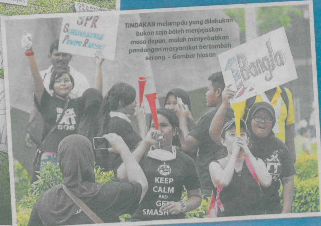
TINDAKAN melampau yang dilakukan bukan saja boleh menjejaskan masa depan, malah menyebabkan pandangan masyarakat bertambah serong. - Gambar hiasan

Menurutnya, walaupun ramai beranggapan golongan terbabit sekadar meraih publisiti murahan atau mudah diperalatkan, pemerhatian dan pemahaman perlu dilihat dari sudut ber-