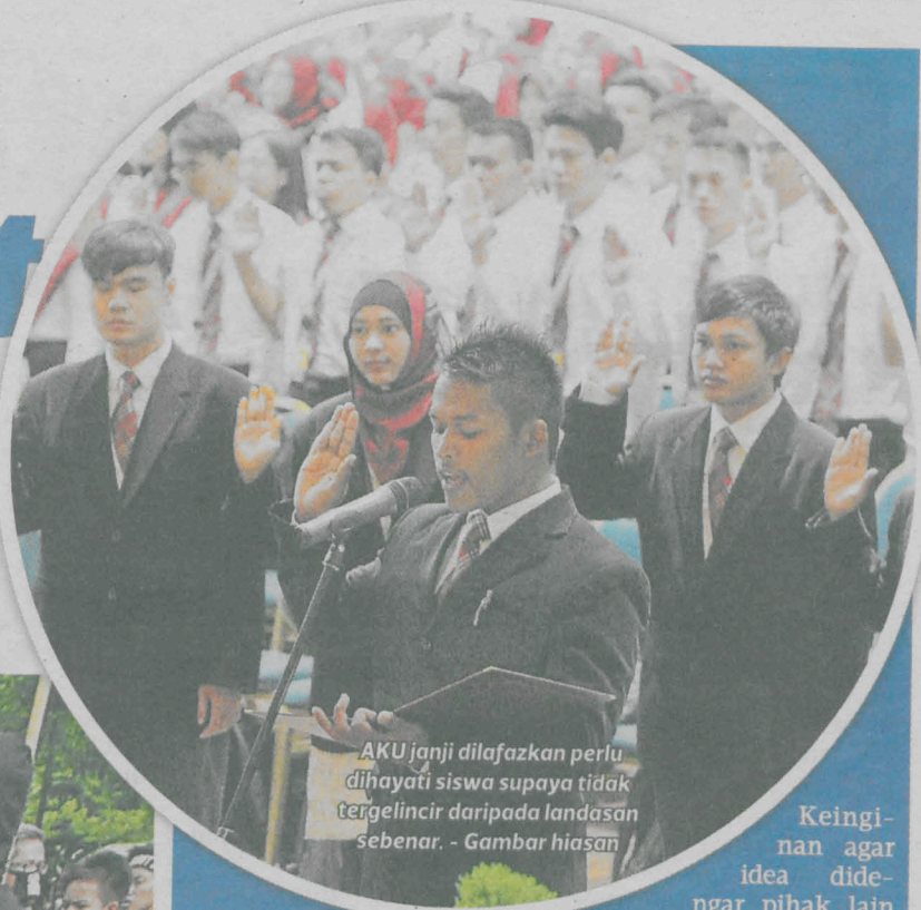
AKU janji dilafazkan perlu dihayati siswa supaya tidak tergelincir daripada landasan sebenar. - Gambar hiasan

Seharusnya mereka sedar diri usah dipergunakan pihak tertentu supaya tidak merugikan masyarakat