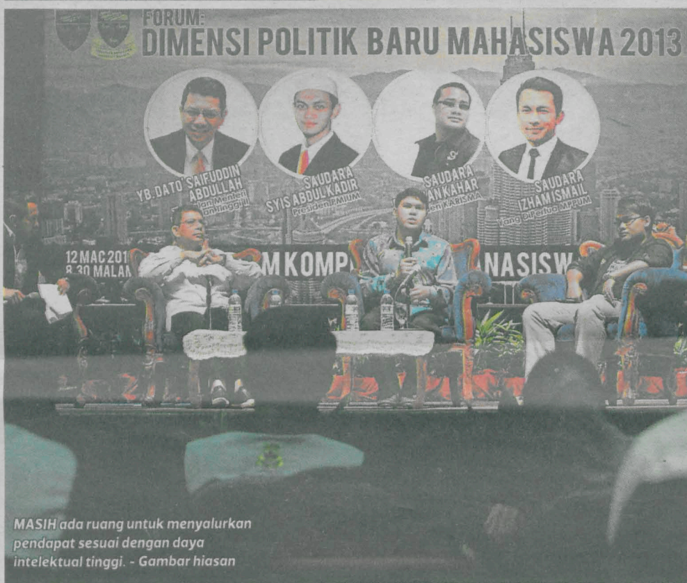
MASIH ada ruang untuk menyalurkan pendapat sesuai dengan daya intelektual tinggi. - Gambar hiasan