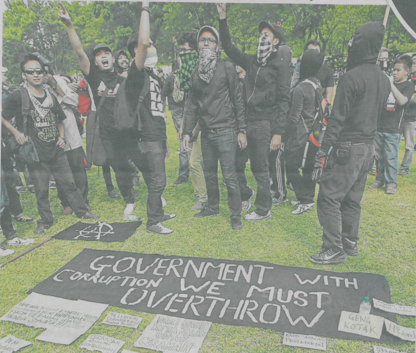
SISWA perlu bertindak rasional dan tidak menggunakan pengaruh emosi untuk meluahkan pendapat. - Gambar hiasan