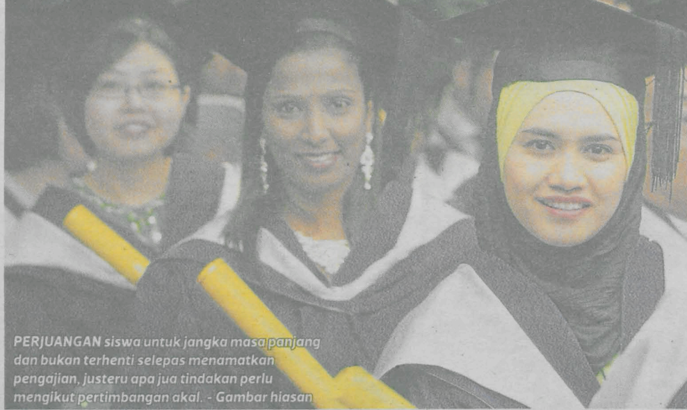
PERJUANGAN siswa untuk jangka masapanjang dan bukan terhenti selepas menamatkan pengajian, justeru apa jua tindakan perlu mengikut pertimbangan akal. - Gambar hiasan

Katanya, siswa perlu menunjukkan daya intelektual tinggi serta tahu arah perjuangan mereka.