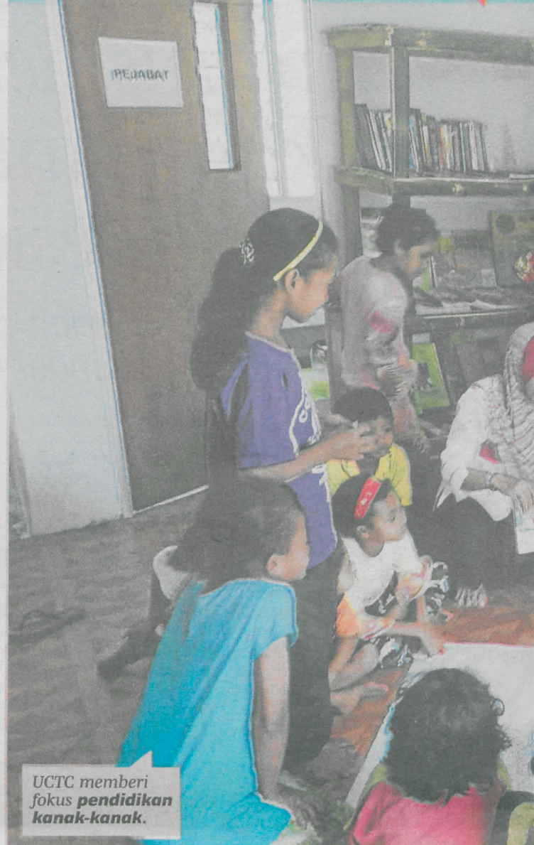
UCTC memberi fokus pendidikan kanak-kanak.

"Selain dalam negara, bantuan luar termasuk dari Jepun turut menaja projek kami. Apa yang penting, matlamat membudaya dan memasyarakatkan UPM, komuniti dan industri berjaya dicapai sepenuhnya," katanya.