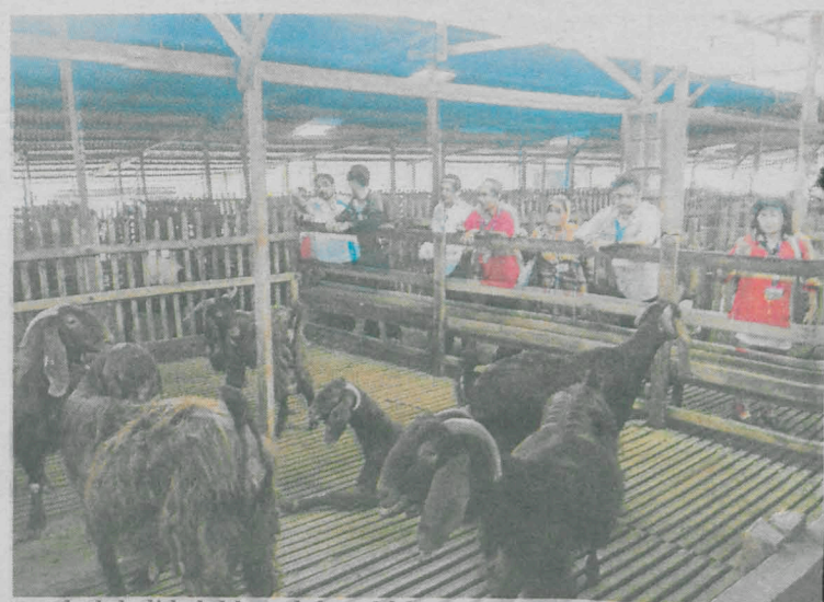
Penduduk didedahkan dalam bidang penternakan.