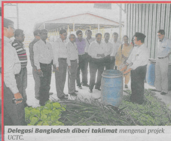
Delegasi Bangladesh diberi taklimat mengenai projek UCTC.