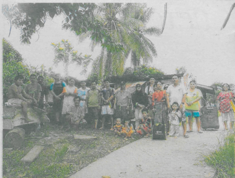
Program UCTC bersama masyarakat Orang Asli.