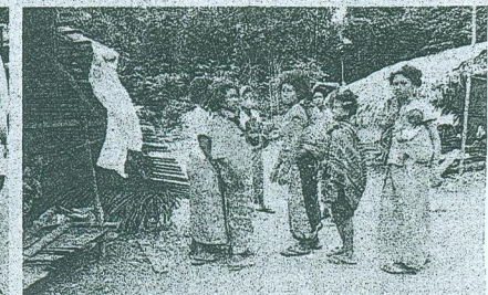
Suasana kehidupan Orang Asli yang jauh dari pembangunan walaupun hutan sekeliling sudah makin gondol. Berapa ramai di kalangan kita yang sudi membantu mereka secara berterusan?