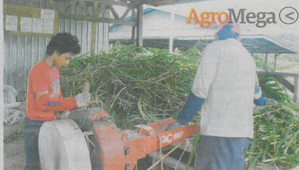
RUMPUT napier dikisar sebelum diberi makan kepada haiwan ternakan.