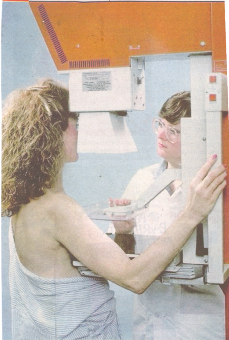
MELALUI CaEd, wanita lebih terbuka berbincang dengan doktor tentang kanser payu dara yang dihidapi.