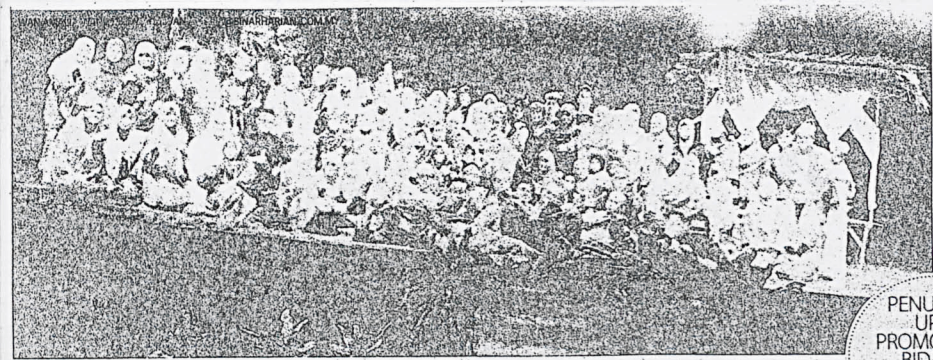
Antara barisan pelakon dan pengurusan Teater Bangsawan Dayang Bunting yang terlibat dalam MTSR-29.