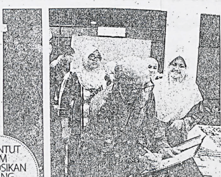
Penuntut UPM Promosikan Bidang Sastera Melalui Teater