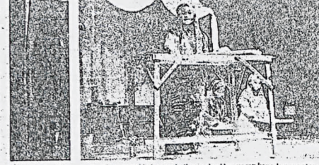
Kehebatan pelakon membawa watak dengan baik memberi kepuasan kepada penonton.

Penuntut UPM Promosikan Bidang Sastera Melalui Teater