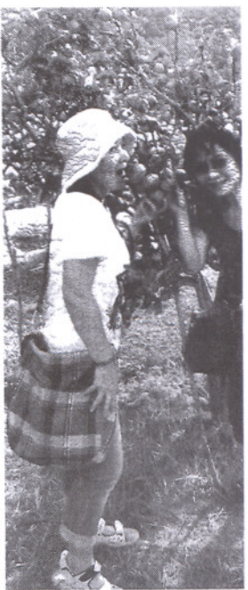
PENGALAMAN menikmati epal di ladang meninggalkan kenangan manis kepa

Oleh ABD. HALIM HADI halim.hadi@utusan.com.my