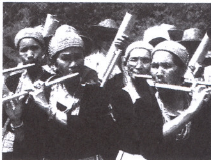
KEUNIKAN budaya masyarakat Lun Bawang juga antara tarikan kuat pelancong untuk ke Ba' Kelalan.

EPAL muda perit dibalut untuk melindunginya daripada panas di serangga.