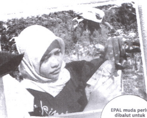
EPAL muda perlu dibalut untuk melindungi daripada panas di serangga.