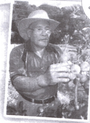
PAK TAGAL kini memiliki kira-kira 3,000 pokok epal di ladang seluas tiga hektar.