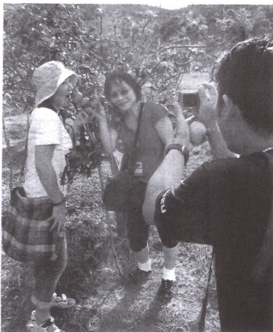
PENGALAMAN menikmati epal di ladang seluas tiga hektar ini pasti meninggalkan kenangan manis kepada pengunjung.