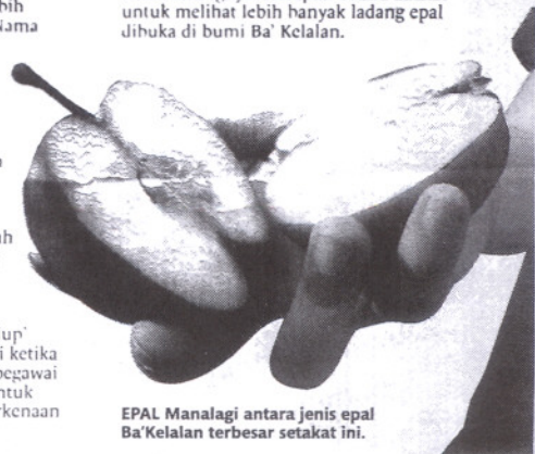
EPAL Manalagi antara jenis epal Ba' Kelalan terbeser setakat ini.