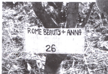
JANGKA hayat bagi sepon pohon pokok dikatakan boleh memecah sehingga 20 tahun.