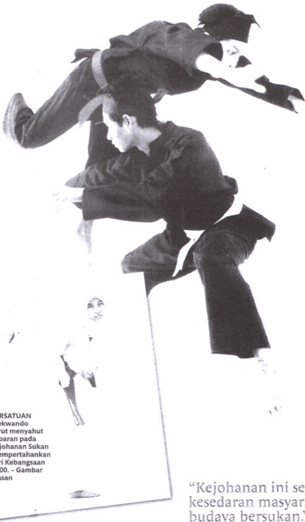
PERSATUAN taekwondo turut menyahut cabaran pada Kejuhan Sukan Mempertahankan Diri Kebangsaan 2009. - Gambar hiasan