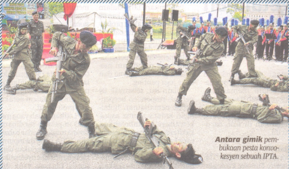
Antara gimik pembukaan pesta konvokesyen sebuah IPTA.

Selain itu, mereka juga boleh meraih pendapatan sampingan dengan bernia-